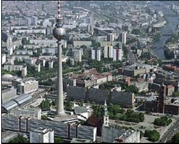
Der Alexanderplatz im Ostteil von Berlin hat noch das größte Wachstumspotenzial der Stadt.

Geschäften auf 36 000 qm Fläche von sich Reden machte. Der Kaufhof hatte zwei Jahre zuvor mit dem spektakulären Umbau seines Warenhauses und seiner ansehnlichen Natursteinfassade einen Beitrag zur städtebaulichen Aufwertung des Platzes geleistet. Die Immobilie räumte mit dem Natursteinpreis und dem Berliner Immobilien Award gleich zwei Preise ab. Interessant ist auch das Geschäftshaus „die Mitte I Shopping am Alexanderplatz“ mit 22 000 qm Fläche, das sich mit allen Geschäften zum Platz hin öffnet und ab 2009 seinen Geschäftsbetrieb aufnimmt. Weitere Projekte sind in Bau oder Planung. Laut Kemper's liegen die Mieten am Alexanderplatz in der Spitze bei 110 Euro je qm.