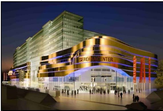
Modell des geplanten Serdika Centers in Sofia

Ein weiteres Projekt plant die ECE mit der Advance Properties Ltd. , eine der größten Immobiliengesellschaften Bulgariens in den nächsten Jahren auf einem ehemaligen