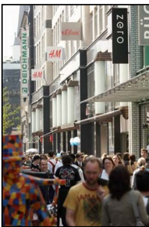
Innenstädte könnten für den Einzelhandel an Attraktivität verlieren.

Hintergrund der Regelung ist laut Hahn-Gruppe – plakativ ausgedrückt - der Generalverdacht des Gesetzgebers, dass der Einzelhandel seine Läden lieber mietet statt sie zu kaufen, um so Steuern zu sparen. Damit solle eine Gleichstellung mit