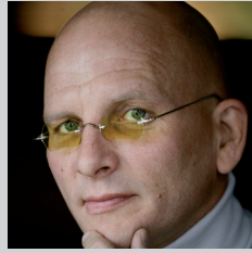
Dr. Kjell A. Nordström