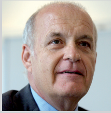
Prof. Götz W. Werner